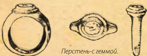
Перстень с геммой. I-II вв. н. э.

Обнаруженные в Мингячевире печати этого периода охватывают в основном временной отрезок с VI в до н.э. до VII в н.э. Часть их,