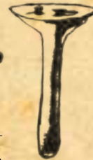
Бронзовый перстень-печать V-IV вв. до н. э.