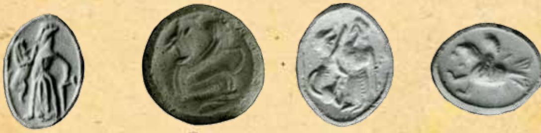
Оттиски бронзовых перстней-печатей V-IV-вв. до н. э.

ны I вв. до н.э. обнаружено в Габале. Это период широкого употребления печатей, что свидетельствует о завершении процесса разложения первобытнообщинного строя, возникновении классового общества и государства, формировании городов. В этот период складывались и расширялись торговые связи с другими странами.