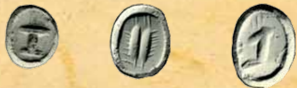
Оттиски гемм-печатей I в. до н. э.-II в. н. э.