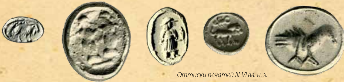
Оттиски печатей III-VI вв. н. э.

которое время пользовался печатью с изображением Александра Македонского, как, впрочем, и печатью со своим изображением. 7