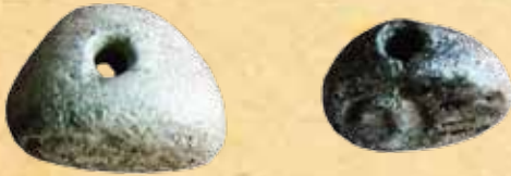
Глиняные печати. Конец IV-первая половина III тысячелетия до н. э.