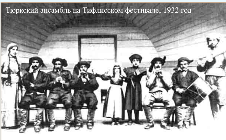
Тюркский ансамбль на Тифлисском фестивале, 1932 год

По официальной информации НКВД, к середине декабря 1944 года было выселено 92.307 человек, из них 18.923 мужчины (старики и инвалиды), 27.399 женщин, 45.085 детей до 16 лет. Первые эшелоны с депортированными турками прибыли в Ташкентскую область 9 декабря 1944 года после 22-дневного пути. Люди, которым было приказано взять еды на три дня, ехали по большей части без продуктов и теплой одежды в разбитых товарных вагонах.