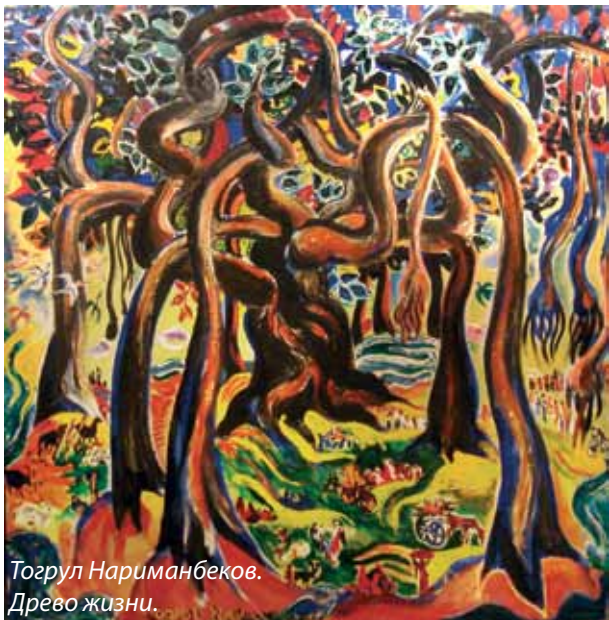
Тогрул Нариманбеков. Древо жизни.