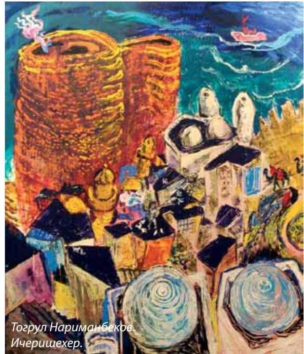
Тогрул Нариманбеков. Ичеришехер.

ворить и говорить. Картины его буквально «поют» нашу родную музыку в праздничный день. Многие из них посвящены нашему родному городу - будто чувствуешь орлиный взгляд художника с высоты птичьего полета (или из окна мастерской у Филармонии с её взлетающими ввысь башнями?)