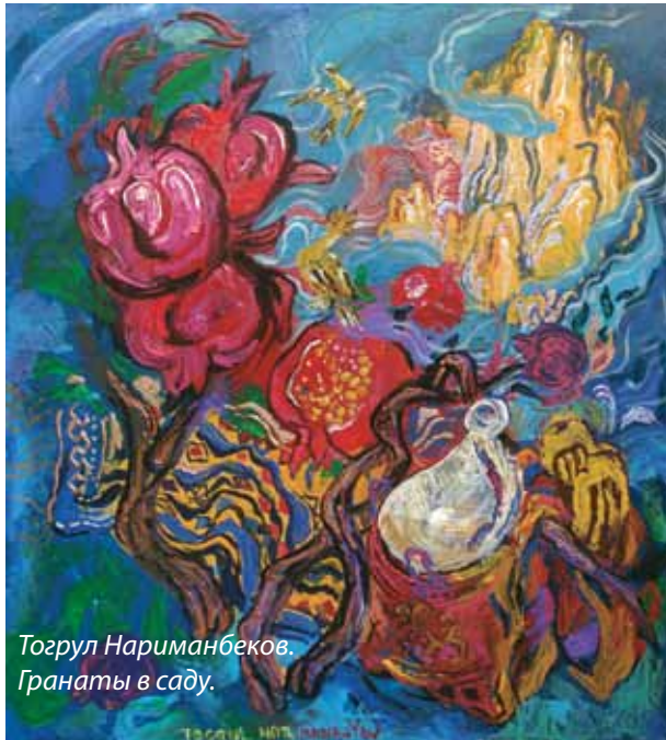
Тогрул Нариманбеков. Гранаты в саду.

каким-то тонким, еле уловимым изысканным шармом: смесью бекского, дворянско-либерального благородства и французского шика. Тогрул всегда был в центре внимания: яркий, красивый, харизматичный, жизнерадостный, любящий розыгрыши и эффекты. В Баку о нем ходили поразительные истории, настолько невероятные, что в пору им быть правдивыми. Энергия цвета и динамика пластики живут в его картинах, суть их – в мощном движении, круговороте, изменении, красочном вихре жизни. Нариманбеков так сильно чувствует жизнь, так её любит и связан с её ритмом, так остро и радостно ощущает все её краски! И одновременно, как истинный художник, он более всего любит свободу, он свободен от всего! Сегодня, на пороге 80-летия, он как никогда молод, палитра его энергична, он пишет радостные пейзажи, портреты и натюрморты, где жизнь бьёт ключом и заряжает зрителя чувством сопричастности и щедрой красоты.