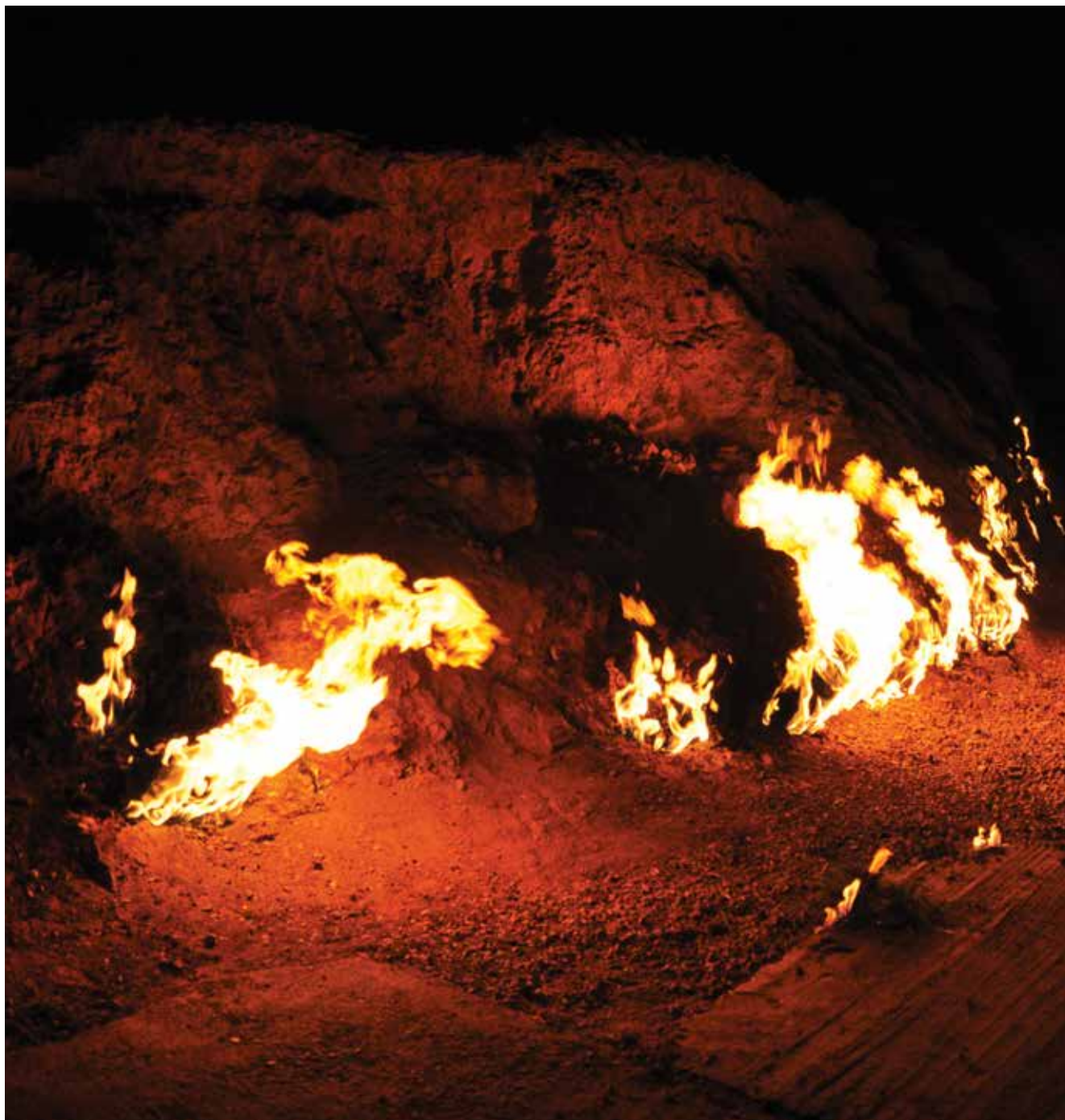
Yanar-dag (“ngọn núi cháy”) là một di tích tự nhiên gần thành phố Ba-cu. Ngọn lửa đã cháy ở đây hàng thiên niên kỷ và chưa bao giờ lụi tàn.

bày 1 đĩa samani, kẹo, hạt, hoa quả khô, trứng được tô màu và nặn rồi gửi chúng tới nhà hàng xóm. Khay khoncha sẽ không bao giờ bị trả lại rỗng mà luôn được bổ sung thêm các thức quả khác của lễ hội như một lời chúc cho gia chủ không mất đi sự thịnh vượng.