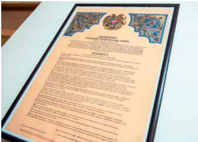
Ermeni Anayasasının kaynağı Ermenistan Bağımsızlık Bildirgesidir.

Bu nedenle, Erivan yönetiminin çok sayıda yetkilisinin şahsında Karabağ’a sahip olma veya herhangi bir “özel statü” verilmesine ilişkin son iddialarının tümü, hiçbir şekilde intikamcılık, savaş sonrası düzenleme anlaşmasını ihlal etme veya tarihi geri getirmek çabası değildir. Hayır, bu, her kademedeki Ermeni yetkililerin, ülkelerinin Anayasa hukuku gereğince görevlerini bilinçli ve dürüst bir şekilde yerine getirmesidir. Ve buna şaşırarak ve öfkelenmemek gerekir. Ermenistan ve Karabağ’ı yeniden birleştirmek amacıyla yeni bir savaş başlatmak için Ermeni-Azerbaycan sınırında silahlı provokasyonlar yapmak, sıradan özel bir girişim veya ayrı-ayrı ordu