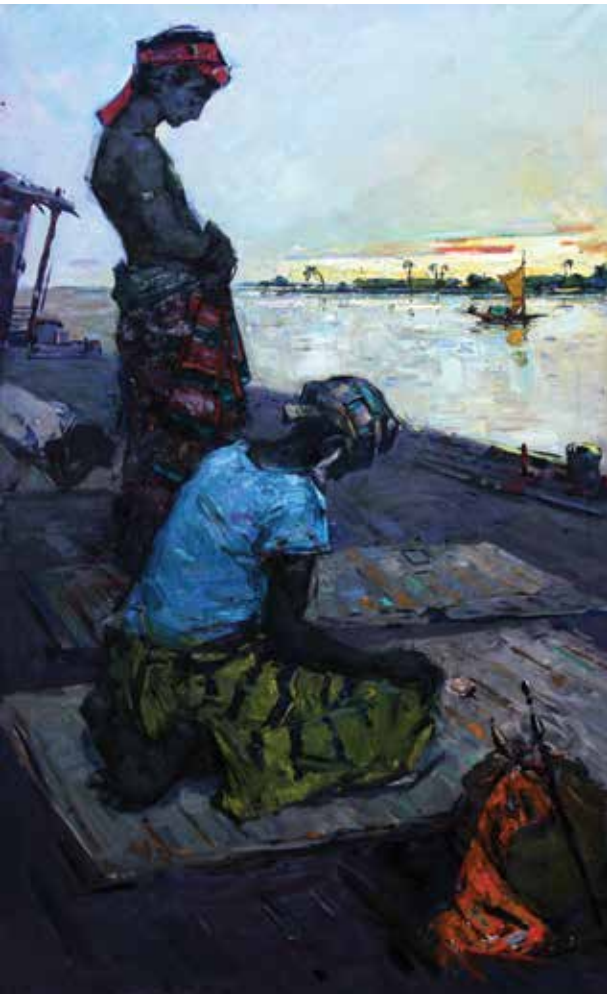
"Вечерняя молитва". Холст. Масло. 1957-1958

образа. В тематических работах художника, созданных в указанном стиле, главной задачей было донести до наблюдателя образы героев труда и их созидательную работу, в основе которой стоит неистощимая сила. Такая направленность в творчестве отвечала и общей идеологической установке той эпохи. В качестве примеров таких работ можно привести картины «У арыка» (1958) и «Под деревом» (1959). Первая из них имеет весьма интересную композиционную структуру: в центре изображен арык, который как бы делит картину на две части. Справа девочка, приглаживающая волосы, приковывает внимание зрителя своим