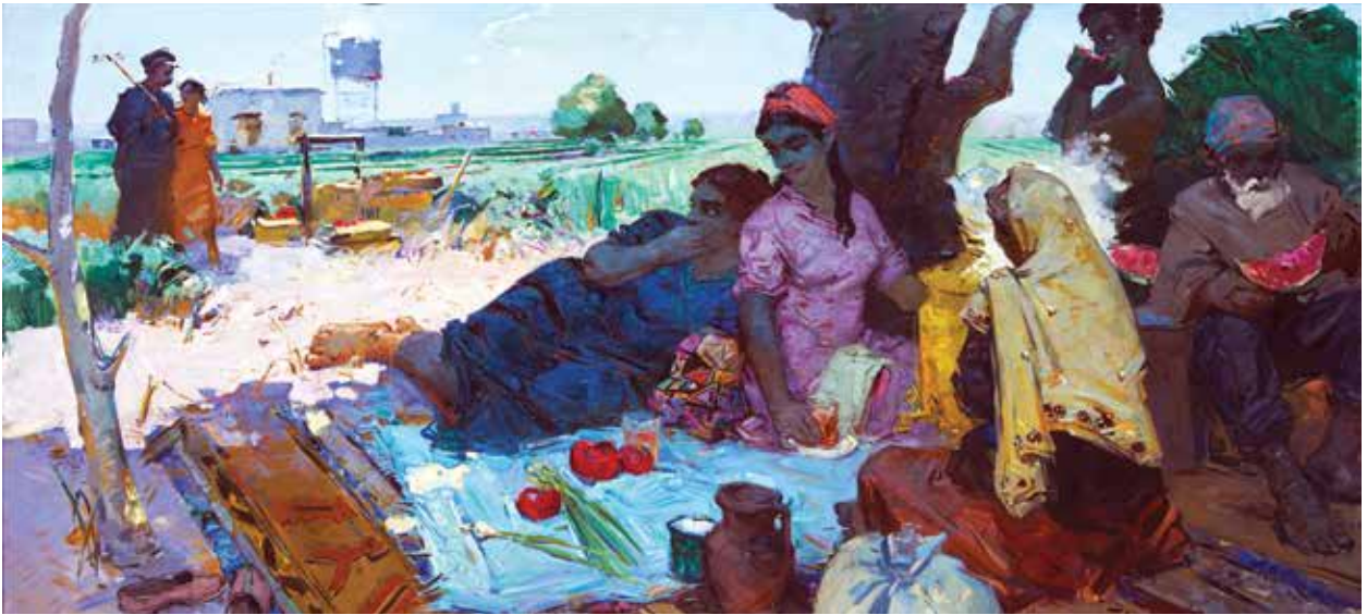
"Отдых". Холст. Масло. 1958-1959