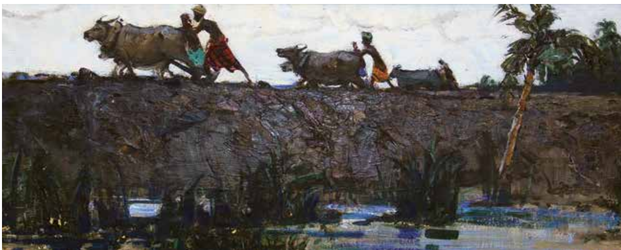
"Индийский юноша". Холст. Масло. 1957