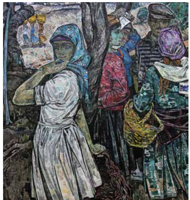
"Слово о завтрашнем дне". Холст. Масло. 1967