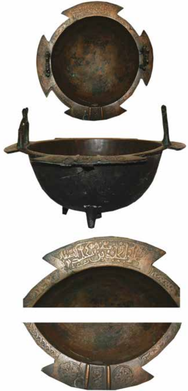
مرجل برونزي من العصر السلجوقي (متحف التاريخ الوطني الأذربيجاني)

لقد ظهرت مع انتشار الإسلام والثقافة الإسلامية مراسم الدفن