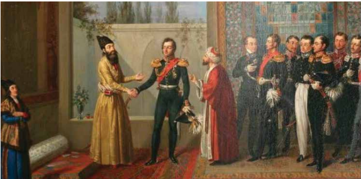
«Свидание Паскевича с наследником персидского престола Аббас-Мирзой в Фейхаргане 7 ноября 1827 года.» Художник М.Залесский, 1830-е годы. Гомельский дворцово-парковый ансамбль. Копия с гравюры К.П. Беггрова по оригиналу В.И. Машкова.

предусматривающая массовое переселение армян из Ирана и порядок сохранения их имущества. Документ также обязывал Персию выплатить России четыре курура (персидская денежная единица, равная в то время миллиону рублей серебром) за расходы, связанные с переселением армян. Включение этой статьи в текст Туркманчайского договора перечеркнуло план российского царского правительства, предусматривавший переселение от 30 до 80 тысяч казаков на приграничные с Персией территории.