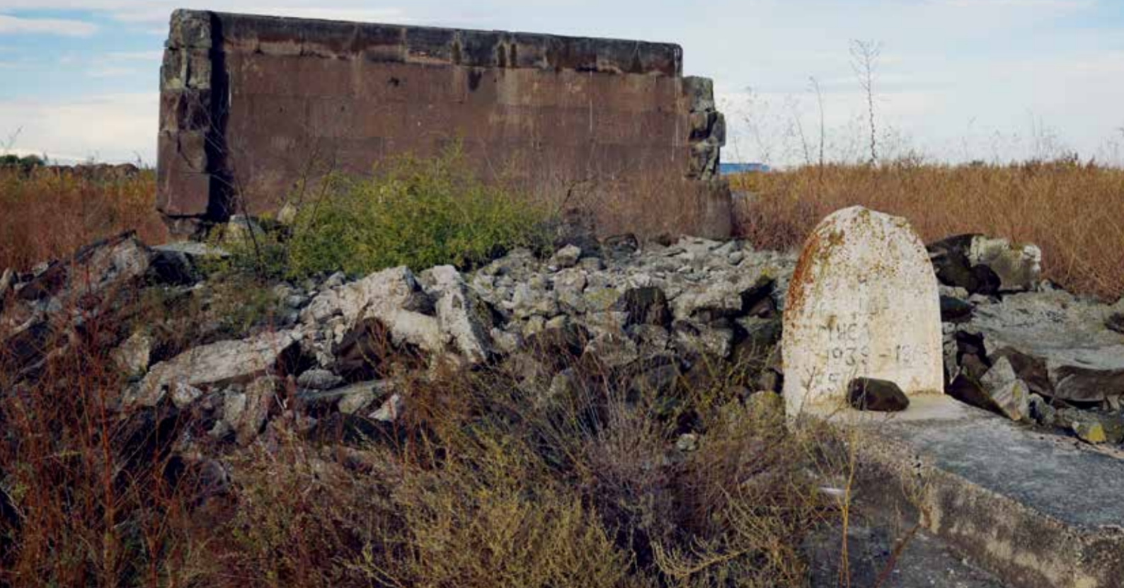
Очередной пример «культурной зачистки» в Армении: разрушенные мавзолей и кладбище азербайджанского села Хабилкенд (переименовано в Норамагс)

шего Иреванского ханства, 71% - мусульмане, и лишь всего 28% - христиане , из которых далеко не все были армянами. Уже упомянутый И. Шопен вынужден был признать, что « в части Древней Армении, принадлежащей России, обитает всех жителей 440 000 душ, из коих большая половина магометане ».