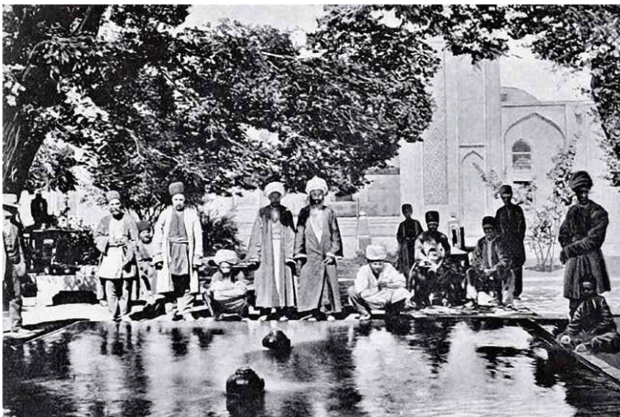
Бассейн во внутреннем дворе Гей-мечети в Иреване. Фото конца XIX века

эчмиадзинский католикос, находившийся под полным контролем российских властей. Тем самым создавались предпосылки для ассимиляции автохтонных албан пришлыми армянами, а они, в свою очередь, присвоив историю албан, стали утверждать, что жили на этих землях испокон веков.