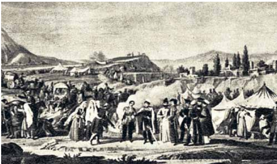
«Переселение армян на земли Азербайджана». Рисунок В.Машкова. 1829 г.

Следующим шагом по арменизации Иреванской провинции стало поэтапное упразднение албанского патриаршества, закончившееся в 1836 году передачей армянской церкви всех албанских храмов, паствы, ценностей и архивов со старинными албанскими рукописями. Отныне главой христиан-албанцев, которых оставалось еще немало в горной местности, был