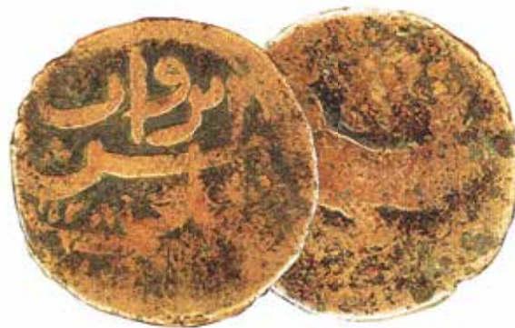
Медная монета Иреванского ханства. Конец XVIII в. НМИА

земли, не были главной целью царского правительства. Скорее это был всего лишь один из инструментов укрепления России во враждебном ей регионе. Меры для этого принимались комплексные , и далеко не все из них по сути своей были антинародными. Преобразования коснулись многих сторон жизни. Прокладывались более удобные и безопасные дороги, шла перепланировка городов, работала почта, а к концу XIX века начал действовать и телеграф, мастерские превращались в предприятия, активно развивалась торговля, открывались больницы и