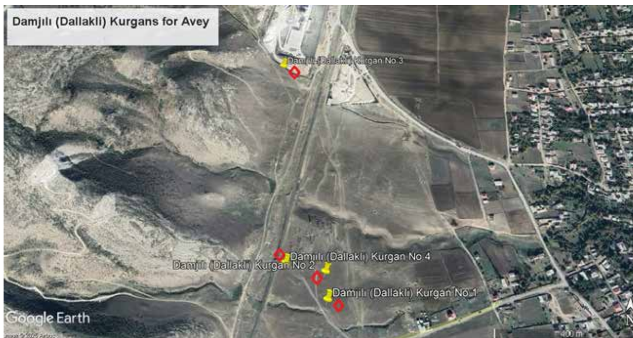
Ареал расположения курганов Дамджылы (спутниковое фото)

На территории государственного историко-культурного заповедника «Авей» на крайнем западе Азербайджана, в пределах Газахского района республики находится комплекс археологических и историко-культурных памятников, охватывающий широкий временной отрезок от каменного века до позднего средневековья. Среди них пещерные и открытые стоянки каменного века, курганы бронзового века, албанская церковь и раннехристианские пещерные храмы поздней античности – раннего средневековья, фрагменты античного