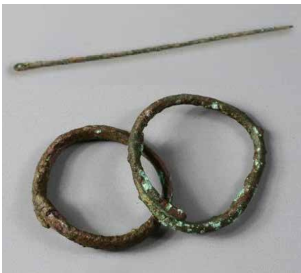
Бронзовые браслеты и игла

Во 2-м кургане могильная камера расположена в северо-западном углу и также ориентирована с востока на запад. Скелет погребенного оказался разбросан по всей камере. Отметим, что в бронзовом веке был распространен культ земли, и поэтому умерших хоронили лишь после проведения так называемого обряда «очищения от плоти» - оставляли на некоторое время на открытом месте, пока дикие животные не съедят останки до костей, которые затем собирали и клали в могилу, или же просто беспорядочно бросали туда.