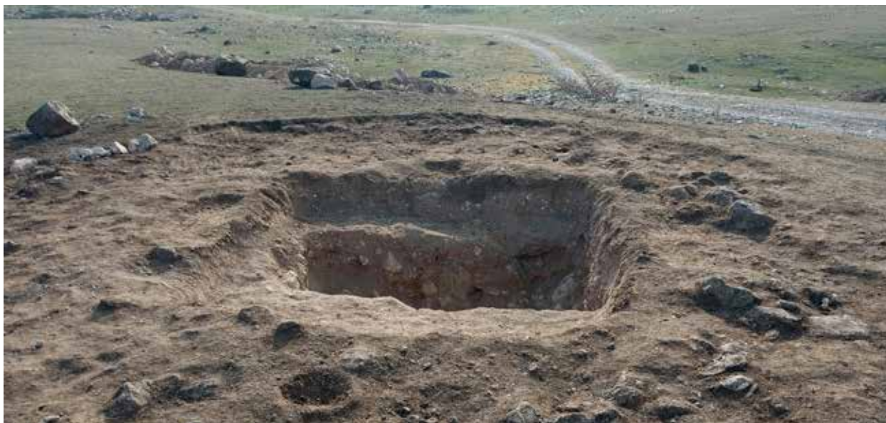
Погребальная камера кургана

Первые исследования памятников Авея были проведены в 50-60-е годы XX века в пещерных стоянках Даш-Салахлы и Дамджылы, где выявлено одно из древнейших в Азербайджане стоянок первобытного человека. За последние годы в пещере Дамджылы азербайджанскими и японскими археологами проведены совместные исследования, давшие новые интересные научные результаты.