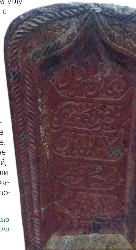
Надгробие с эпиграфической надписью на кладбище Деллекли