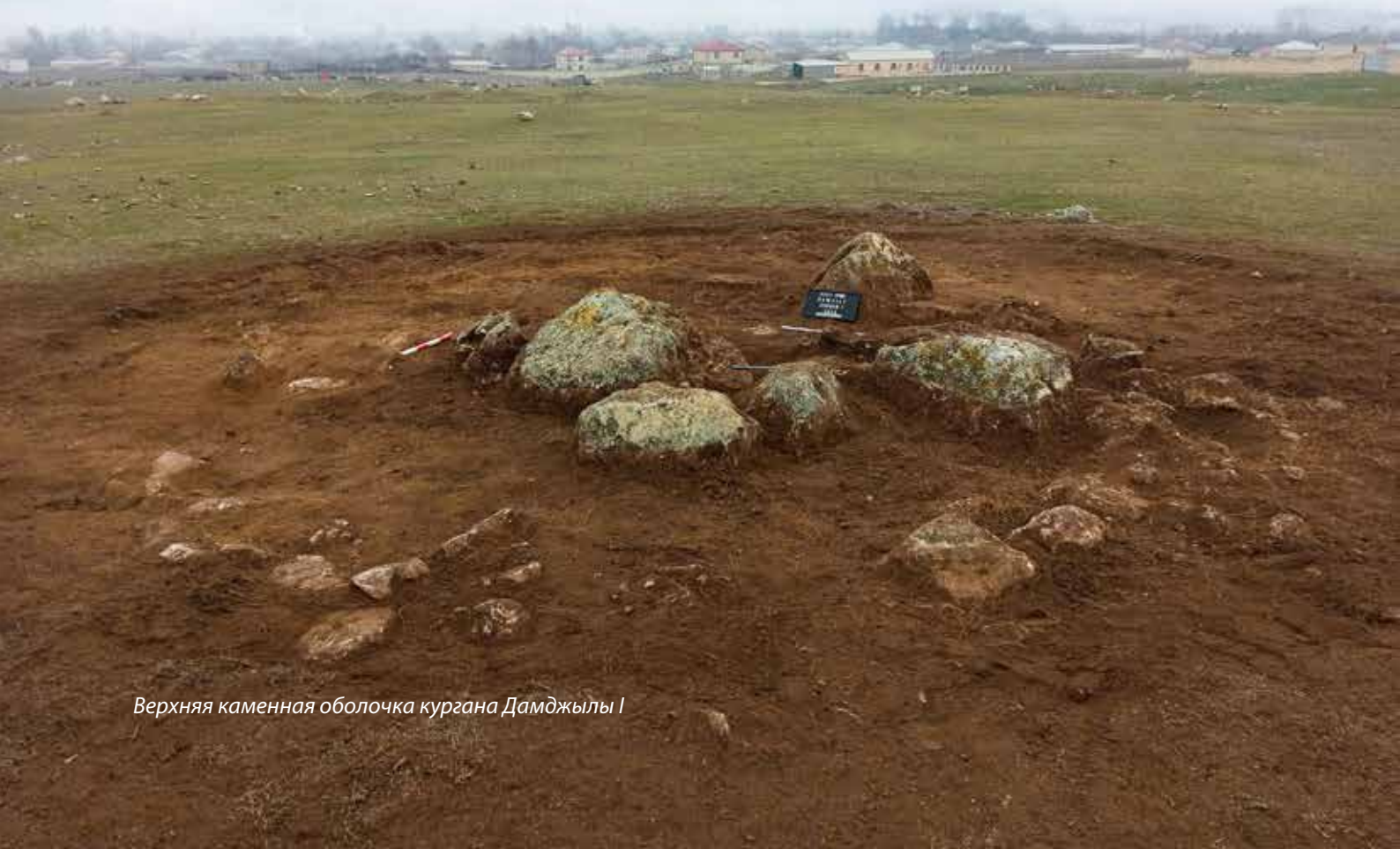
Верхняя каменная оболочка кургана Дамджылы I